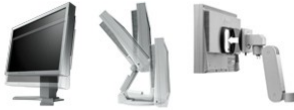
Height adjustable stand EzUp stand QM1 quick mount attachment